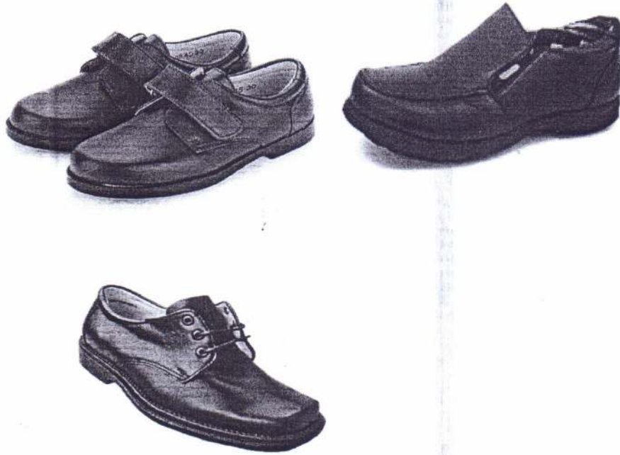
MODELOS DE ZAPATOS PARA ALUMNAS (COLOR NEGRO)